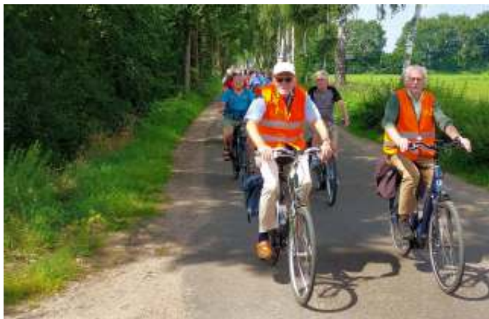
Foto van de fietstocht 4 augustus (24 deelnemers met een pauze in De Schaapskooi in Vorstenbosch)

Weer een fietstochten op woensdag 1 september. Vertrek vanaf Zijlstraat 1a om 13.30 uur.