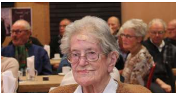
Ons oudste lid