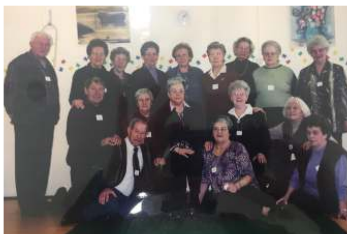
De koersbalgroep van 25 jaar geleden

Als je jezelf ook eens lekker wilt laten verwennen ga je natuurlijk mee ! Meld je aan bij Maria van Berloo, mail naar: kboheeswijk.secr@gmail.com of bel met 06-14155166. Vertel je naam, tel. nummer, of je per fiets of auto gaat, zelf wilt rijden of mee wilt rijden (€ 2,- betalen aan chauffeur). Laat ook even weten als je een dieet moet volgen! Aanmelden kan tot dinsdag 2 april maar wacht niet te lang want er kunnen maar 25 mensen mee ! WELKOM !!